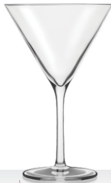
HQ Manhattan 23 23 cl - H 169 mm - Ø 105 mm