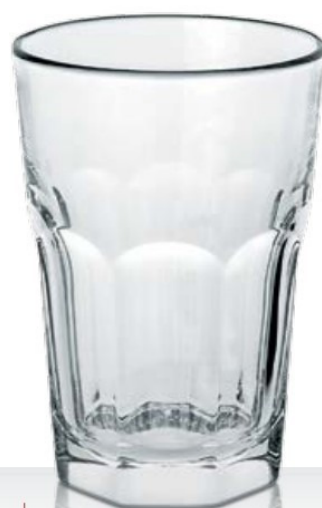
Casablanca 36/42 LD temperato

36 cl - H 122 mm - Ø 82 mm 42 cl - H 131 mm - Ø 86 mm