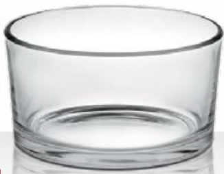
Indro 9 22 cl - H 50 mm - Ø 90 mm