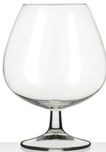
Ballon 81 cognac magnum 81 cl - H 154 mm - Ø 115 mm