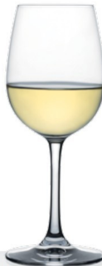
HQ Weinland 29 29 cl - H 190 mm - Ø 75 mm