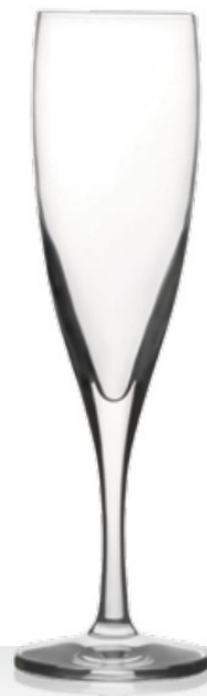
Standard 11 11 cl - H 185 mm - Ø 47 mm