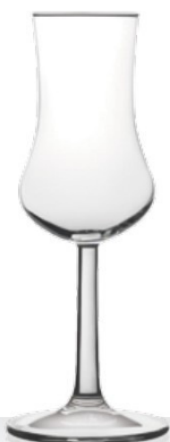
Taro 9 cl - H 157 mm - Ø 61 mm

Soluzioni eleganti, pensate per un fine pasto o un momento di relax molto speciale