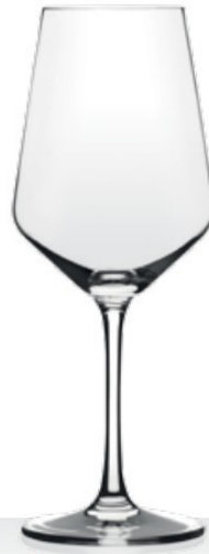
HQ Harmony 35 35 cl - H 209 mm - Ø 81,5 mm