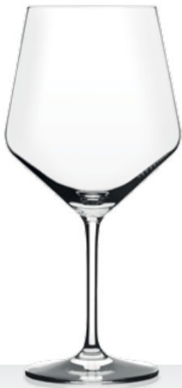
HQ Harmony 72 72 cl - H 229 mm - Ø 110 mm