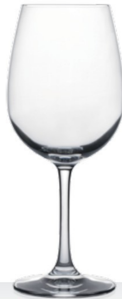
HQ Weinland 45 45 cl - H 205 mm - Ø 85 mm