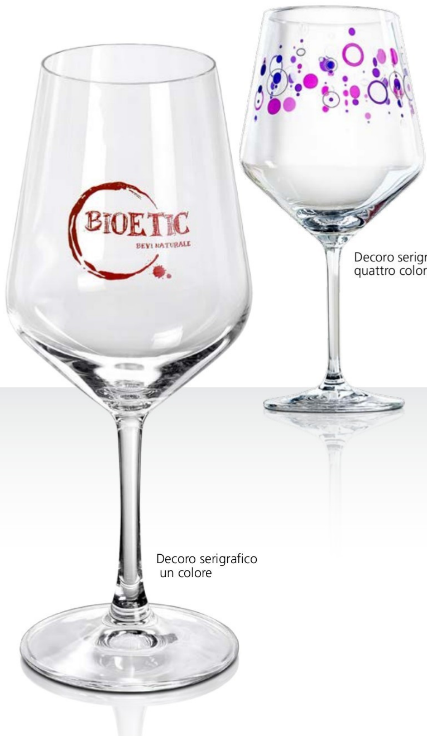
Decoro serigrafico quattro colori

Per la realizzazione di prodotti esclusivi che includono il logo o altri segni distintivi del prodotto vengono realizzati appositi stampi incisi che rendono unico il risultato. Tecnica disponibile solo su grandi lotti di produzione.