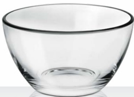
Coppa 10 22 cl - H 52 mm - Ø 100 mm