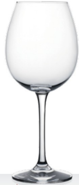
HQ Winebar 62 62 cl - H 235 mm - Ø 98 mm