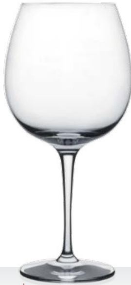
HQ Viana 72 72 cl - H 217 mm - Ø 108 mm