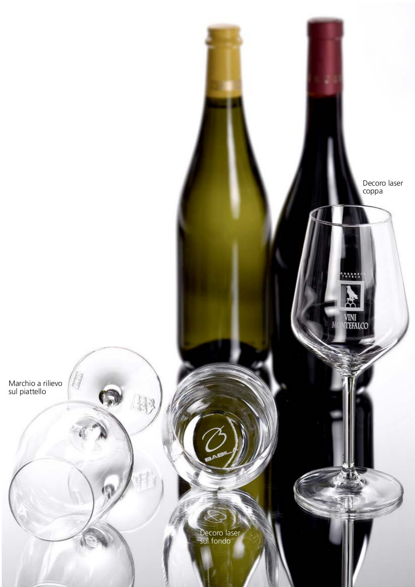
Marchio a rilievo sul piattello