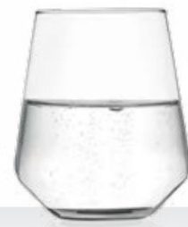
Harmony acqua 40 cl - H 103 mm - Ø 88 mm