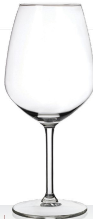
Smart 55 55 cl - H 210 mm - Ø 92 mm