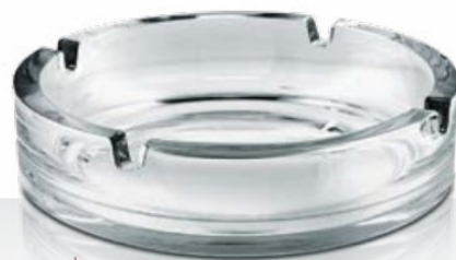
Dresda 107 36 cl - Ø 107 mm