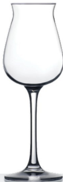
HQ Grappa Tasting ANAG 13,5 cl - H 170 mm - Ø 60 mm