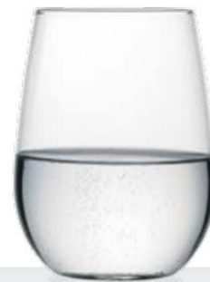
HQ Viana 50 50 cl - H 116 mm - Ø 88 mm