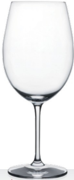
HQ Viana 74 74 cl - H 235 mm - Ø 99 mm