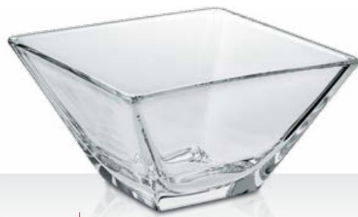
Quadra 10 27 cl - H 58 mm - Ø 105x105 mm