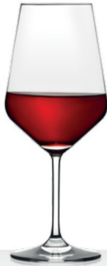
HQ Harmony 53 53 cl - H 223 mm - Ø 92 mm