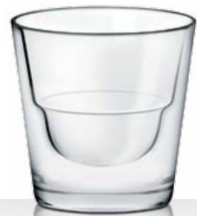
Conic R/30 13 cl - H 73 mm - Ø 73 mm