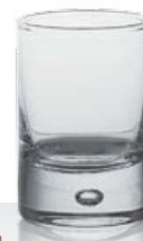
Disco 5 5 cl - H 67 mm - Ø 45 mm