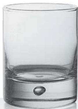
Disco 29 29 cl - H 93 mm - Ø 76 mm