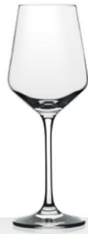
HQ Harmony 23 23 cl - H 189 mm - Ø 71 mm