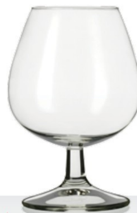
Baloon 37 brandy 37 cl - H 128 mm - Ø 86 mm