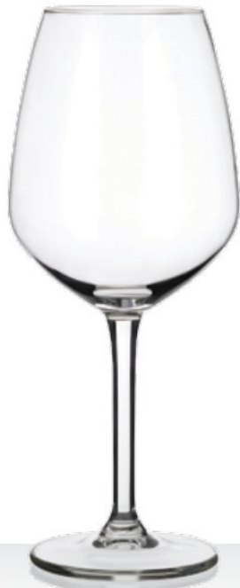
Smart 39 39 cl - H 198 mm - Ø 83 mm