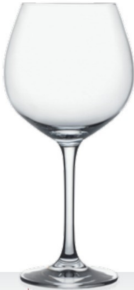
HQ Winebar 74 74 cl - H 227 mm - Ø 108 mm