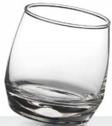
Cuba fondo conico 27 cl - H 88 mm - Ø 67 mm