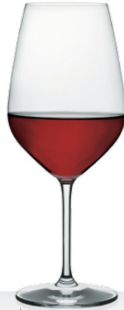
HQ Viana 64 64 cl - H 238 mm - Ø 96 mm