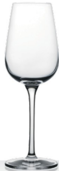
HQ Winebar 19 19 cl - H 187 mm - Ø 64 mm