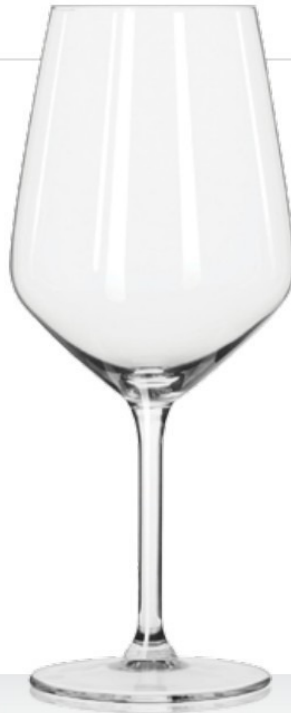
Carrè 53 53 cl - H 217 mm - Ø 92 mm