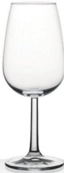
Mosella 23 23 cl - H 168 mm - Ø 65 mm