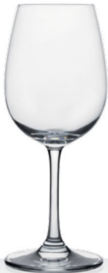
HQ Weinland 35 35 cl - H 195 mm - Ø 79 mm