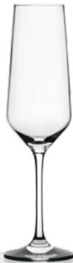
HQ Harmony 20 20 cl - H 221 mm - Ø 64 mm