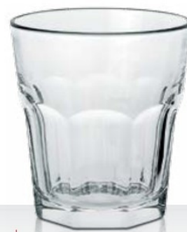
Casablanca 13,7 temperato 13,7 cl - H 76 mm - Ø 72 mm