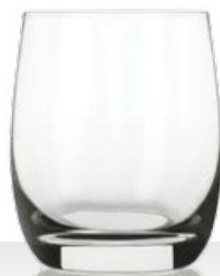
HQ Globo 35 cl - H 96 mm - Ø 82 mm