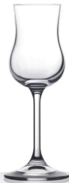
Trentino grappa 12 cl - H 168 mm - Ø 54 mm