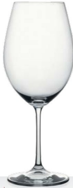
HQ Winebar 64 64 cl - H 228 mm - Ø 93 mm