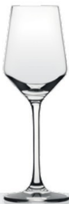
HQ Harmony 11 11 cl - H 169 mm - Ø 58 mm