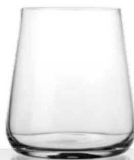
Winebar acqua 38 cl - H 90 mm - Ø 85 mm