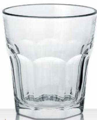
Casablanca 36 dof temperato 36 cl - H 100 mm - Ø 91 mm