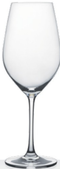
HQ Viana 42 42 cl - H 222,5 mm - Ø 82 mm