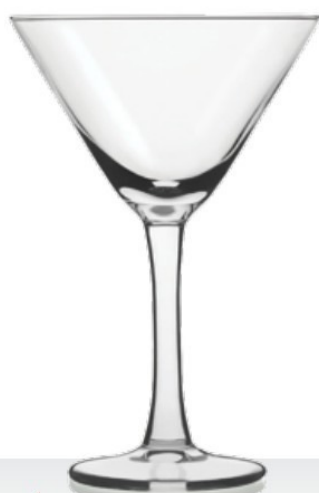
Martini 19 19 cl - H 146 mm - Ø 99 mm