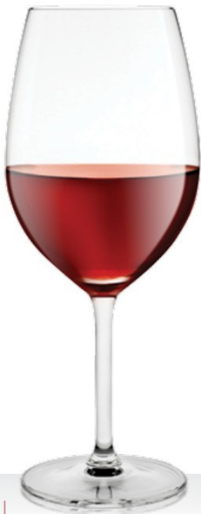
Degustazione 51 51 cl - H 219 mm - Ø 89 mm