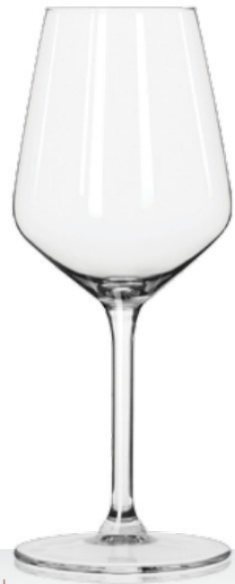
Carrè 35 35 cl - H 200 mm - Ø 84 mm