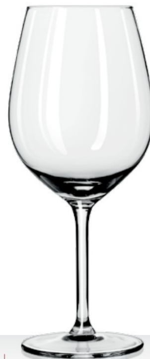
Fortius 51 cl H 213 mm Ø 92 mm