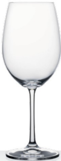
HQ Winebar 35 35 cl - H 209 mm - Ø 80 mm