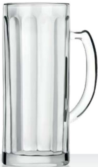
Deutscherren / Reno Ottico