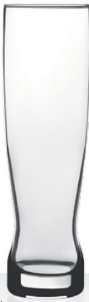
Focus 38,5 | 65,2 cl 0,3 | 0,5 l