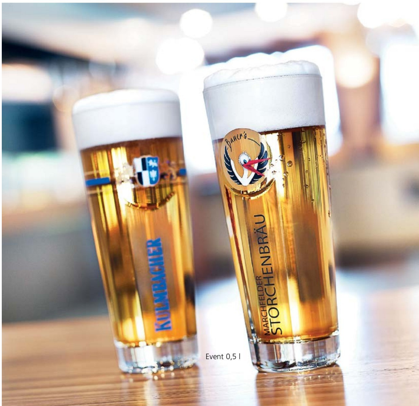
Event 0,5 l