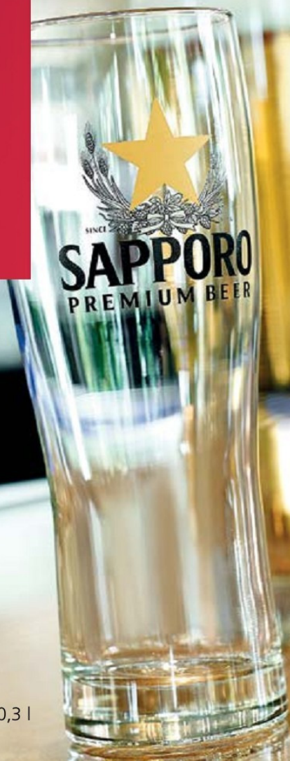
Monaco 0,5 l

Questo processo migliora la resistenza allo shock del vetro e quindi ne aumenta la durata nel tempo.