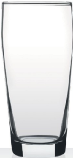
Willi - Becher

28,4 | 38,3 | 47,0 | 66,0 cl 0,2 | 0,3 | 0,4 | 0,5 l