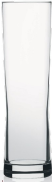
Fresh 37,5 | 61,1 cl 0,3 | 0,5 l