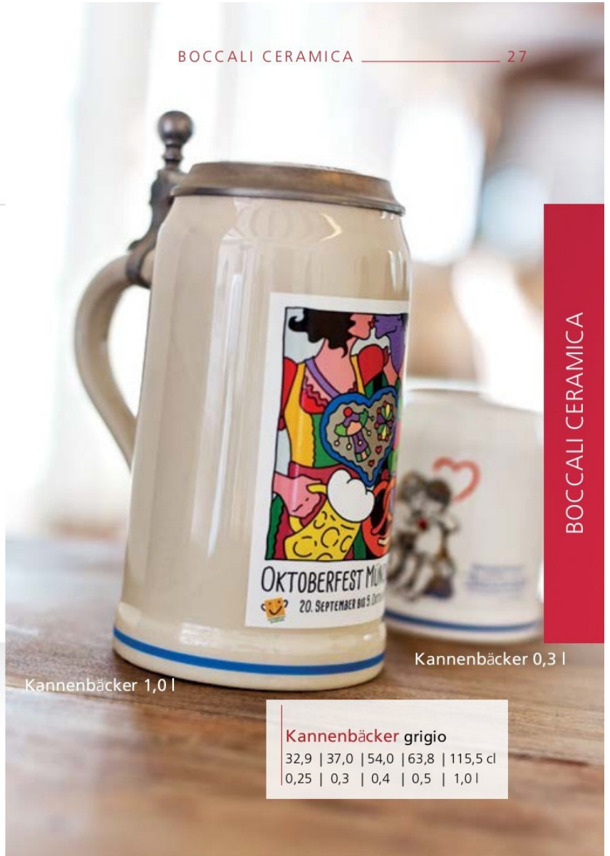
Kannenbäcker 1,0 l