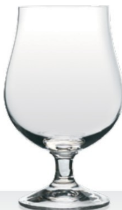
HQ Lüttich 37,5 | 51,3 cl 0,3 | 0,4 l