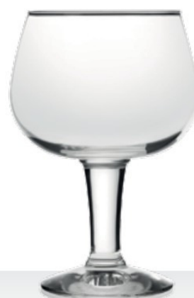
Gusto 43,0 | 65,0 cl 0,3 | 0,5 l