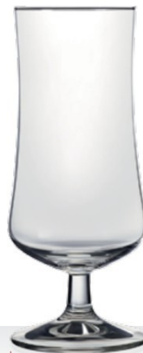
London 24,0 | 47,0 cl 0,2 | 0,4 l