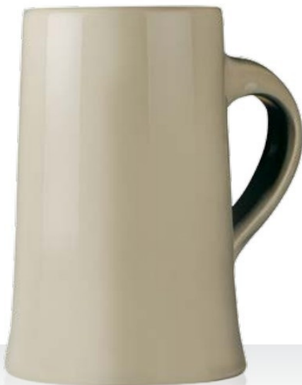
Alpspitz grigio o bianco

Kannenbäcker grigio 32,9 | 37,0 | 54,0 | 63,8 | 115,5 cl 0,25 | 0,3 | 0,4 | 0,5 | 1,0 l