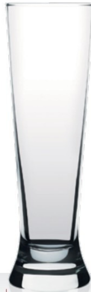
Mercur 41,8 | 68,5 cl 0,3 | 0,5 l

Designpreis Rheinland-Pfalz 2007 Preisträger