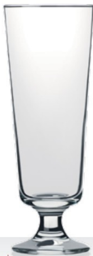
Braucherstutzen 40,0 | 66,0 cl 0,3 | 0,5 l