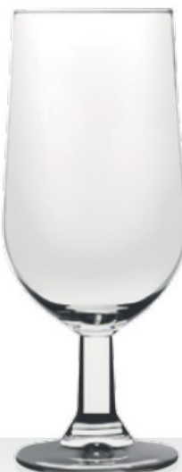
Reno 26,0 | 49,0 cl 0,2 | 0,4 l