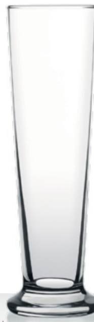
Basic 38,0 | 64,5 cl 0,3 | 0,5 l