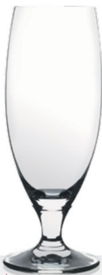
HQ Elite 39,4 | 50,5 cl 0,3 | 0,4 l