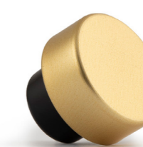
Metallizzato Oro gambo master nero