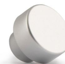
Metallizzato Argento gambo master argento

Per una nuova finitura non realizzabile con le nostre attrezzature standard, riferimento Labrenta.