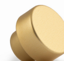
Metallizzato Oro gambo master oro