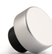
Metallizzato Argento gambo master nero